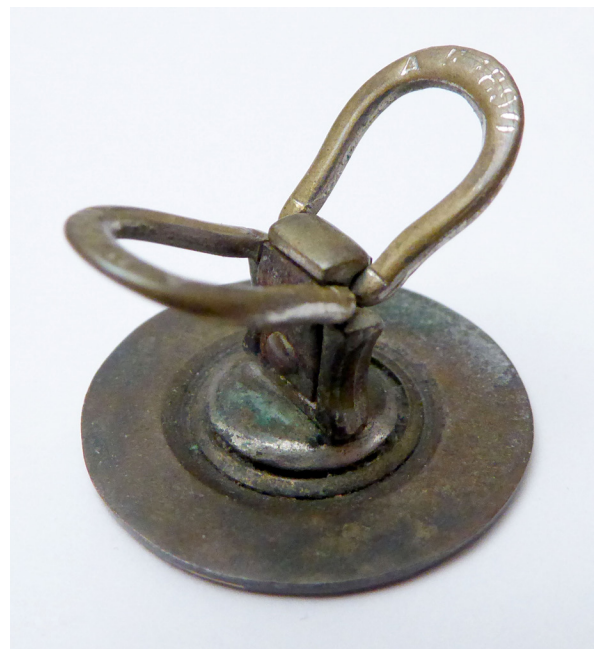
Fig. 6a+b: Manchetknap i forgyldt messing. For- og bagside.