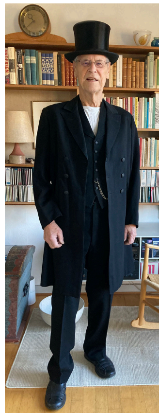
Fig. 3: Diplomatsættet med åbenstående frakke på model. Da skjorte med tilbehør ikke er bevaret, er det sat sammen med en hvid t-shirt Foto: Randi Solvang.