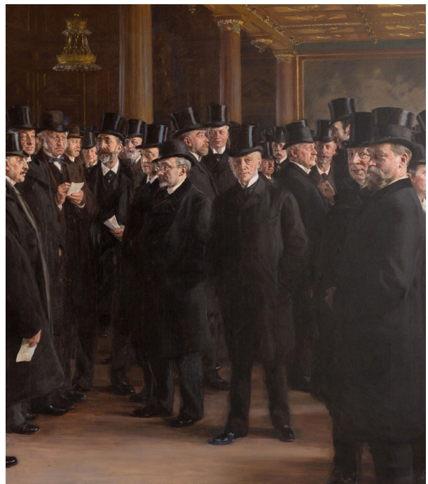
Fig. 2: C.F. Tietgen, der kigger direkte på beskueren, og mange andre af tidens finansmænd på Børsen. Mændene er iført diplomatsæt. Fra Københavns Børs. Maleri af P.S. Krøyer, 1895.