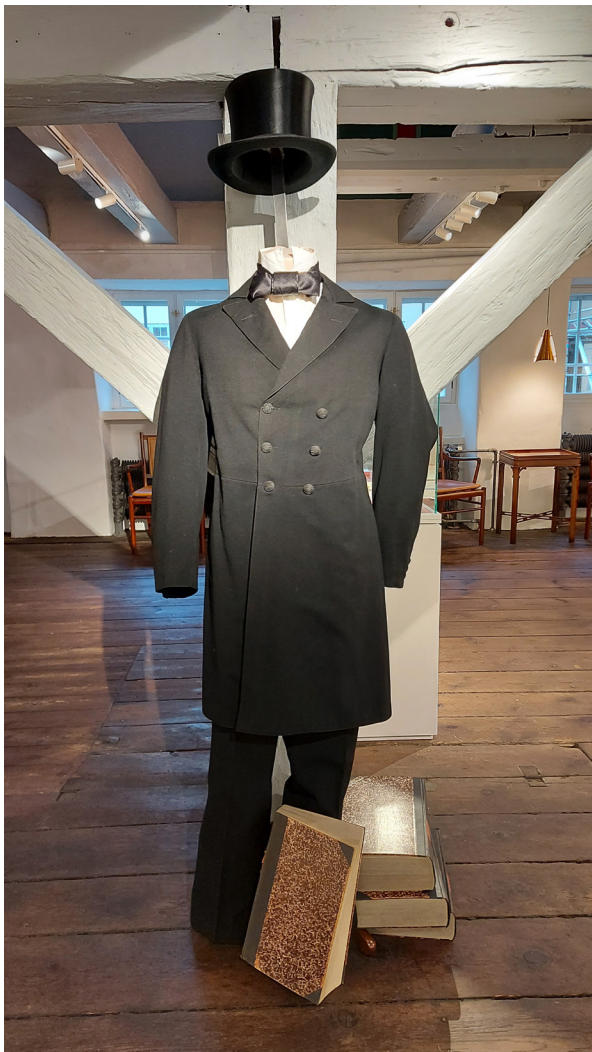
Fig. 1: I udstillingen på Bank- og Sparekassemuset er diplomatsættet med til at illustrere finansmanden C.F. Tietgen.