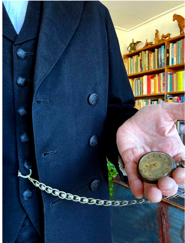
Fig. 5: Ur med urkæde af nikkel, der hører til diplomatsættet. Skal det være særlig fint, bliver urkæden i nikkel udskiftet med en i guld.